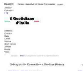
Salvaguardia Connection a Gardone Riviera. Life Salvaguardia è il Progetto Europeo organizzato da Cauto, una Cooperativa di tipo B attiva sul territorio bresciano, che si occupa di energia, rifiuti, categorie fragili e non solo...